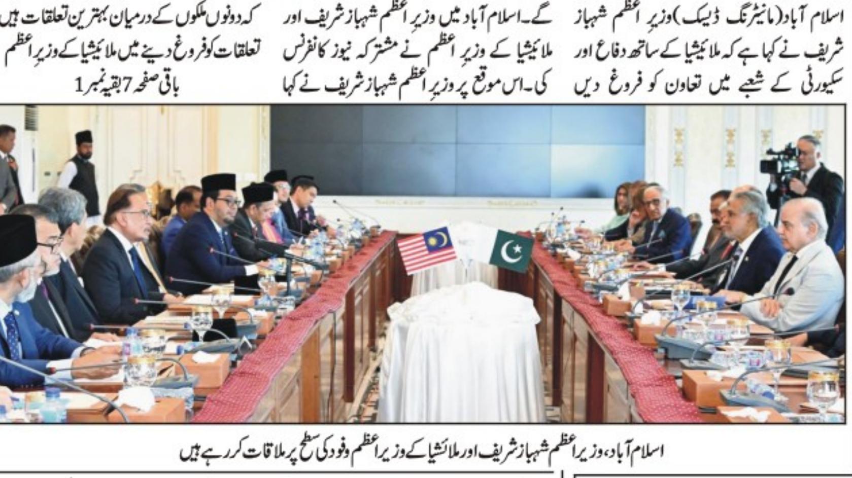
اسلام آباد، وزیر اعظم شہباز شریف اور ملائیشیا کے وزیر اعظم انوار Ibrahim کی ملاقات کر رہے ہیں۔

ملایشیا کے ساتھ دفاع اور ریکوری کے شعبے میں تعاون کو فروغ دینے میں ملایشیا کے وزیر اعظم کی قابل قدر خدمات ہیں۔ اعلیٰ سطح وفد کو خوش آمدید کہتے بہزادوں پاکستانی طلباء ملایشیا میں زیر تعلیم ہیں، مقبوضہ کشمیر کے عوام نے اپنے حقوق کی خاطر بہت قربانیاں دی ہیں اور وزیر اعظم کی ملائیشیا میں مقیم ہونے سے ان کے حقوق کو فروغ دینے میں ان کی مدد ہوگی۔