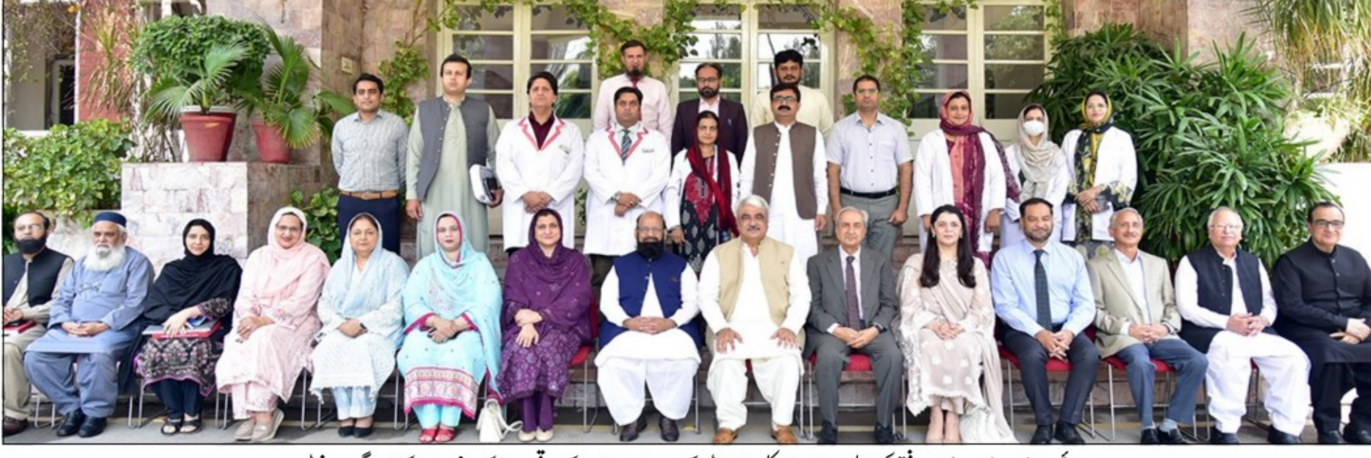
صوبائی وزیر رحمت خواجہ مسلمان رفیق کی فاطمہ جناح میڈیکل یونیورسٹی کے 43 ویں اجلاس کے موقع پر سینیٹ کیٹ ممبران کے ہمراہ گروپ فوٹو

مسلمان رفیق کی زیر صدارت فاطمہ جناح میڈیکل ہسپتال میں 43 ویں ایجنڈا اجلاس منعقد ہوا۔ مسلمان رفیق کی زیر صدارت فاطمہ جناح میڈیکل ہسپتال میں 43 ویں ایجنڈا اجلاس منعقد ہوا۔